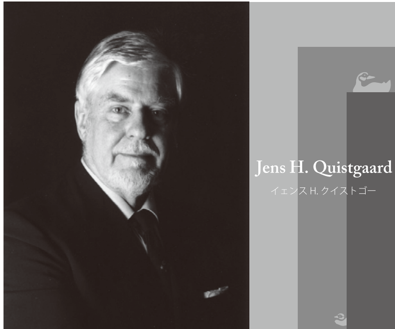
Jens H. Quistgaard