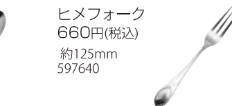
ヒメフォーク 660円(税込) 約125mm 597640