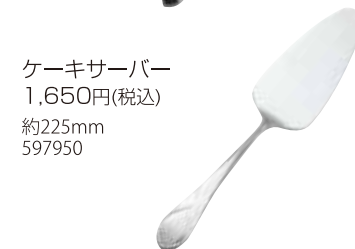
ケーキサーバー 1,650円(税込) 約225mm 597950