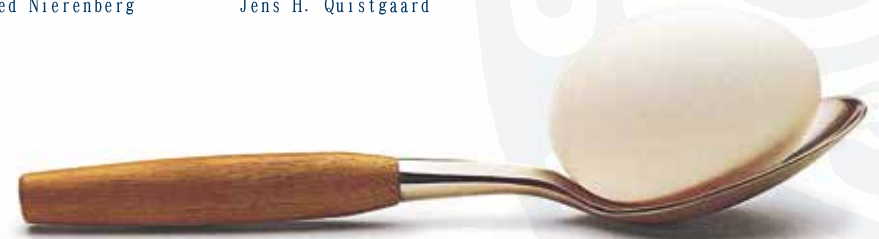
Fjord(フィヨルド) デザイン: イェンス・クイストゴー 最初の製品。約30年間販売され続けました。