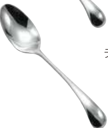
ティースプーン 1,375円(税込) 約140mm 587620