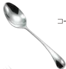
コーヒースプーン 1,100円(税込) 約128mm 587630