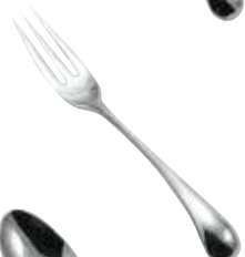
ヒメフォーク 1,100円(税込) 約132mm 587640