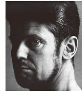
Jens H. Quistgaard