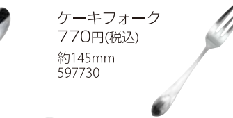
ケーキフォーク 770円(税込) 約145mm 597730