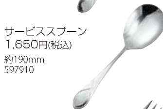
サーブスプーン 1,650円(税込) 約190mm 597910