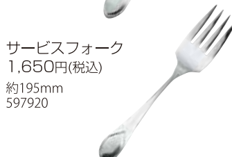
サーブフォーク 1,650円(税込) 約195mm 597920