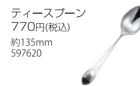
ティースプーン 770円(税込) 約135mm 597620