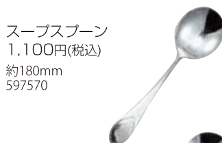
スープスプーン 1,100円(税込) 約180mm 597570