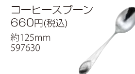
コーヒースプーン 660円(税込) 約125mm 597630